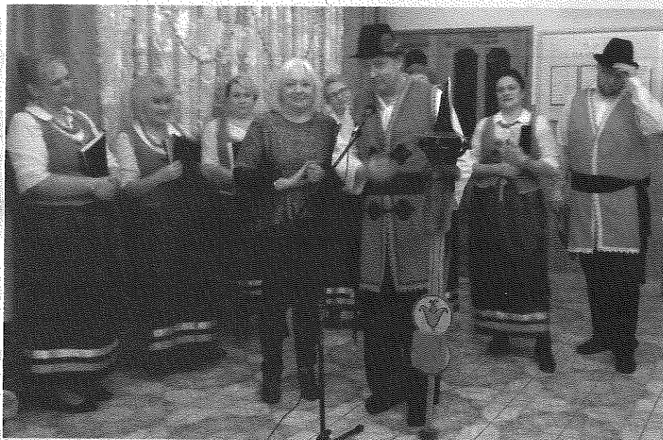
Kapela „Łubianioki” przywiozła do Pigży nie tylko diabelskie skrzypce, ale także ognisty temperament